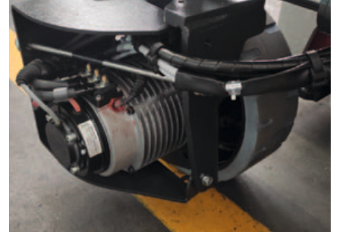
Motor electric AC; virare electrica pana la 90°