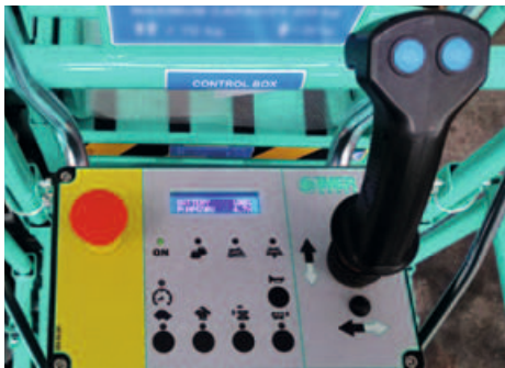
Panou de control detasabil cu butoane capacitive: simplitate si siguranta in utilizare