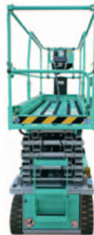
Noul design al PEA (Platforma elevatoare autopropulsata) al pachetului de foarfece.