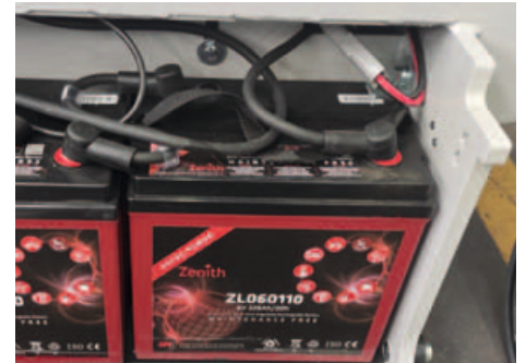
Compartiment pentru bateriile AGM